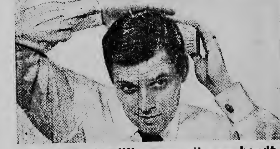
voor het uiterlijk waar zij van houdt